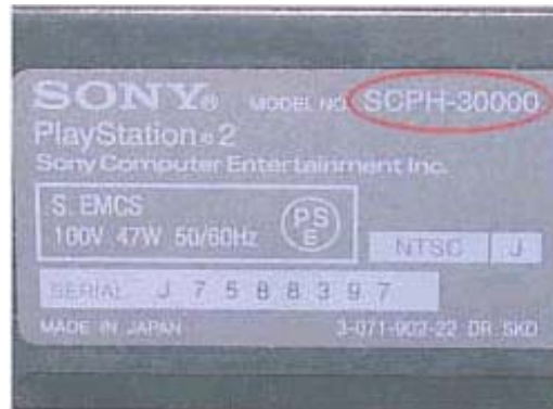
Imagen de Ejemplo.

Esta versión de chip PnP es compatible con toda la serie SCPH-3000x. Es decir solo placas V4